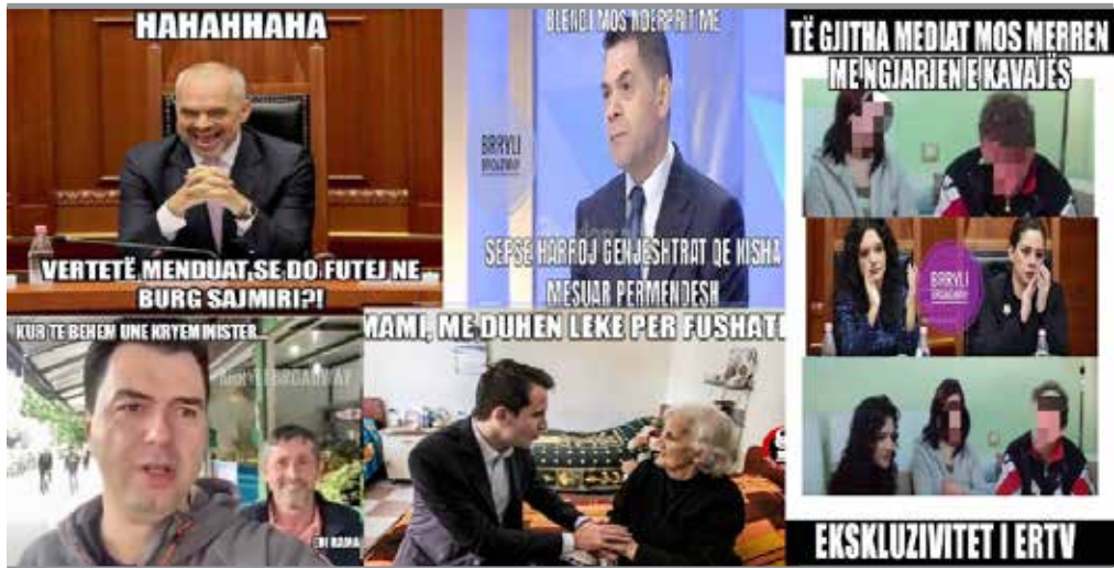
Fig 1: Një montazh memesh të gjetura gjatë monitorimit

Një teori tjetër e rëndësishme që përbën boshtin e këtij kërkimi është edhe ajo e Influencës Personale e Paul Lazarfeld dhe Elihu Katz (2017) ku, në rrjedhën me dy hapa, mesazhet mediatiche ndikojnë më shumë mbi njerëzit jo në drejtimin media-audiençë por media-lider opinionit- audiençë. Në këtë mënyrë do të shihen me kujdes edhe liderët e opinionit, meme-krijuesit.